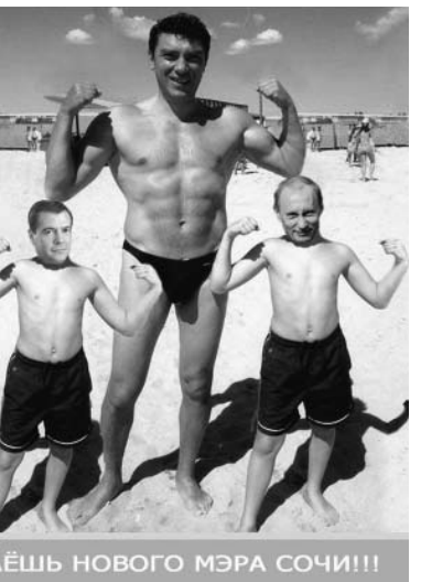
ДАЕШЬ НОВОГО МЭРА СОЧИ!!!

Между тем сочинский журналист, попросивший не называть его имени, сообщил, что 12 марта за несколько часов до пресс-конференции Немцова сотрудники пресс-службы адми-